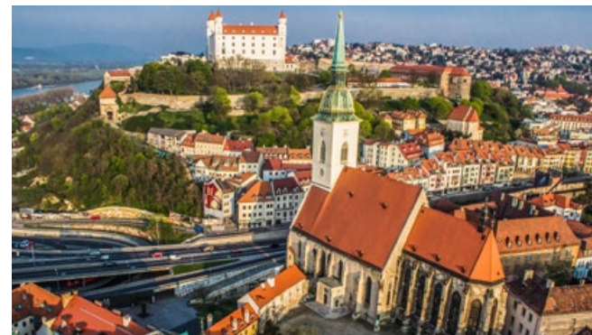
Bratislava City Card