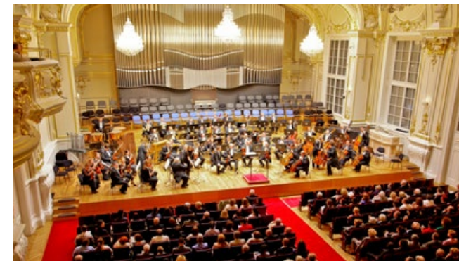
Bratislava City Card