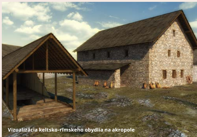
Vizualizácia keltsko-rímskeho obydli na akropole

K vzniku keltského oppida (opevneného sídla) na území dnešnej Bratislavy na konci 2. storočia pred Kr. prispela výhodná geografická poloha na križovatke diaľkových ciest. Keltské mesto v Bratislave zaberalo plochu približne 98 hektárov (asi 100 futbalových ihrísk). Na hradnom vrchu dominovala opevnená akropola . Podhradie sa rozprestieralo na území dnešného Starého mesta a na dnešnom Námestí slobody existovala predhradná osada . Keltské osídlenie siahalo aj mimo centrum, devínske oppidum bolo strategickým obchodným miestom.